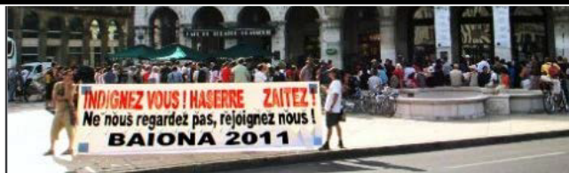
Les indignés de Bayonne (Pyrénées-Atlantique) (Jean-Sébastien Mora).

« T'es pas comme les blédards, t'es pas blédard »