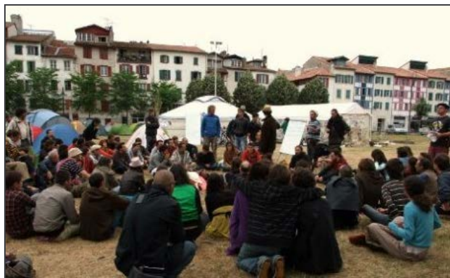
Les indignés de Bayonne (Pyrénées-Atlantique) (Jean-Sébastien Mora).

Le campement bayonnais est modeste mais compte une trentaine de tentes, une grande yourte, une cuisine, des toilettes sèches et tient des assemblées générales de 200 personnes.