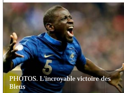
PHOTOS. L'incroyable victoire des Bleus