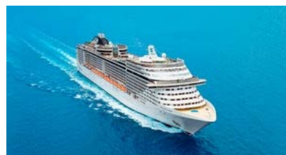
Sponsorisé par MSC

Catch : pourquoi le show "Survivor Series" est en péril