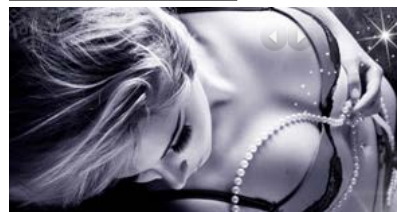
Sélection Lingerie >> VOIR