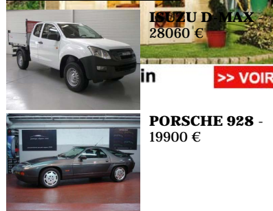
ISUZU D-MAX 28060 €