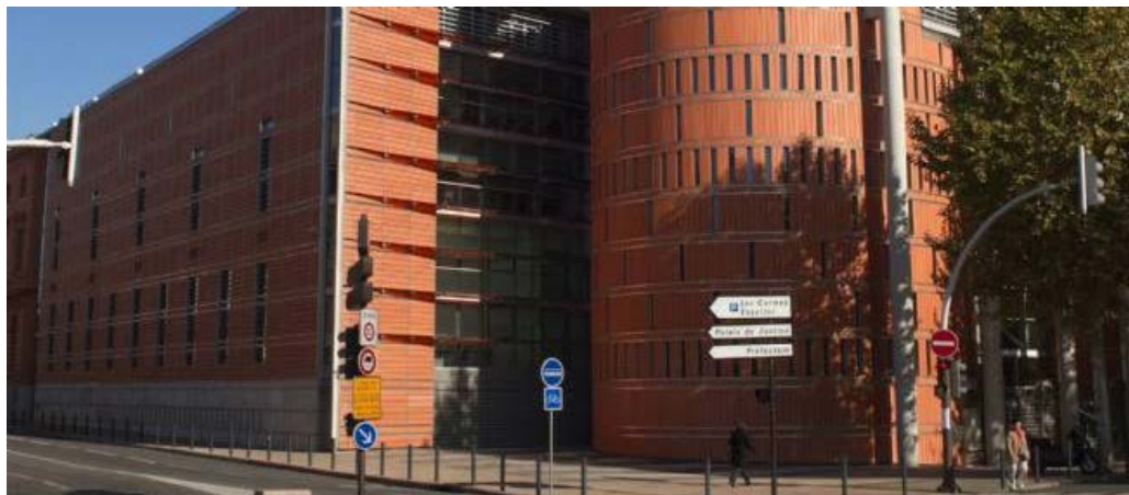
Le tribunal de Toulouse (photo d'illustration)

Soupçonné d'avoir prodigué "des conseils" à des personnes concernées par des affaires judiciaires, le magistrat toulousain a été suspendu de ses fonctions dans le cadre d'une affaire qui pourrait connaître des développements dans d'autres juridictions.