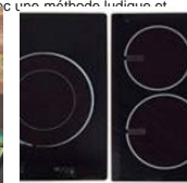
Tables de cuisson à induction - Ne pas... (UFC Que Choisir)