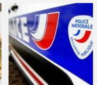
Berck-sur-Mer: le corps de l'enfant...