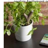
EN IMAGES. Des accessoires high tech...

Un mois de formation Gymglish gratuit ! OFFRE SPECIALE PARTICULIERS : progressez en anglais facilement avec une méthode ludique et