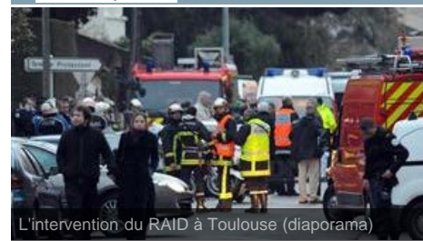
L'intervention du RAID à Toulouse (diaporama)